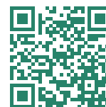
Videyo lekòl segondè espesyalize