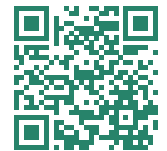
특수목적 고등학교 비디오